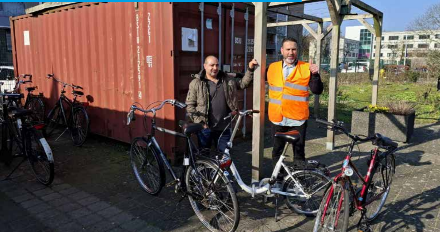
TEKST ARJEN VAN REE